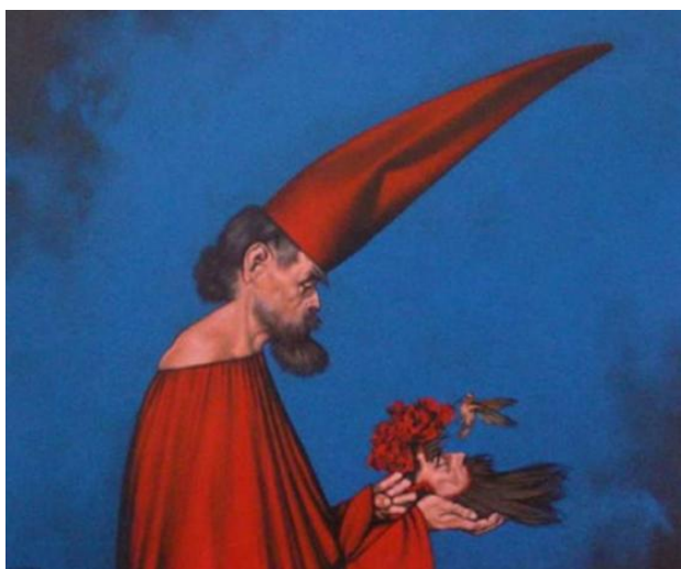
"Concierto al pichón" (2003)