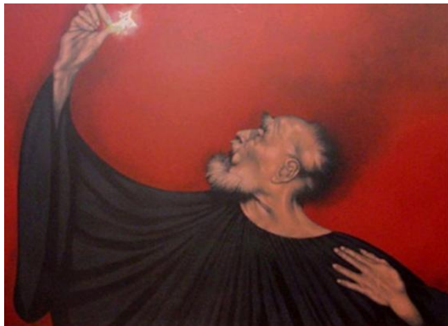
"Tiziano y su mujer" (1995)